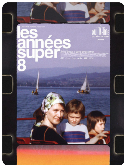
Quinzaine des Réalisateurs - Festival de Cannes 2022.